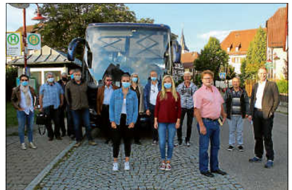
Mit Bürgermeister Karlheinz Oehler (Dritter von rechts) besichtigte der Wiernsheimer Gemeinderat am Donnerstag Seniorenheime der beiden Investoren, die sich für den Neubau des Wiernsheimer Seniorenheims beworben haben, um sich einen Einblick in deren Arbeit zu verschaffen.