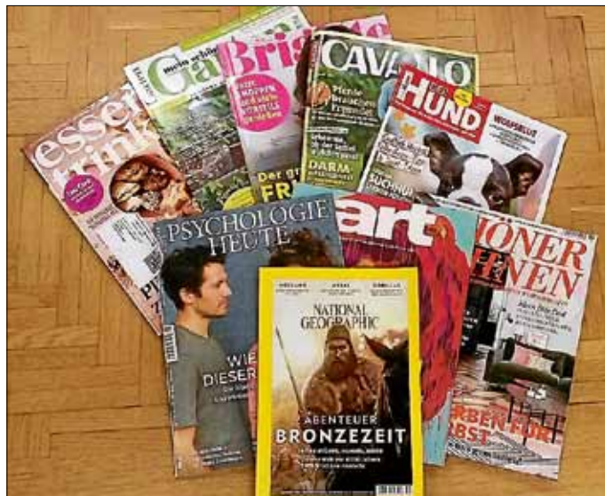
Zeitschriften zu verschenken

Die Bücherei ist ab sofort wieder zu den üblichen Öffnungszeiten geöffnet. Aktuell haben wir die ausgemusterten Zeitschriftenjahrgänge des Vorjahres zu verschenken. Wer schnell ist, kann sich mit vielen interessanten Zeitschriften eindecken. Außerdem gibt es einen großen Bücherflohmarkt mit aussortierten Romanen, um Platz für neue Bücher zu schaffen.