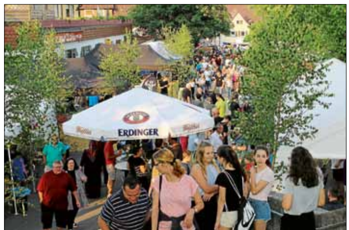
Sehr gut war der Besuch des Wiernsheimer Straßenfestes am Samstagabend.