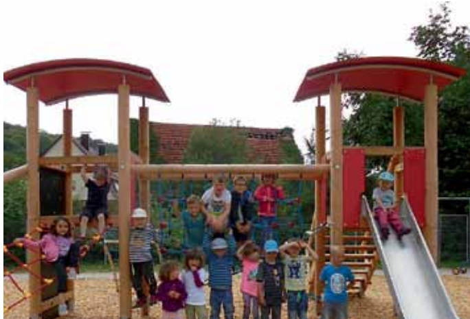
Die Kinder vom Iptinger Kindergarten „Vogelhäuschen“