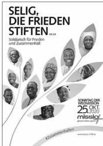
weltmissionssonntag2020 Plakat: Missio