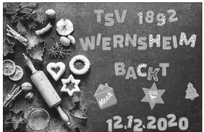
TSV Wiernsheim backt