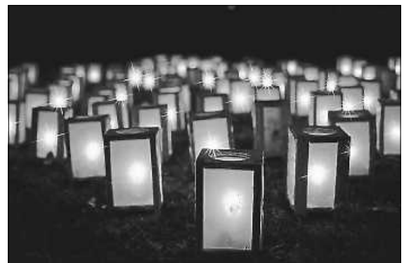
Ein Meer von Lichtern soll leuchten

Unter der Voraussetzung, dass wir uns ab Januar 2021 wieder unserem regulären Programm zuwenden können: