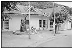
Kreuzbachhalle Iptingen

Die SPD-Bundestagsabgeordnete Katja Mast teilt mit, es sei geschafft: 632.000 € für die Sanierung unserer Kreuzbachhalle in Iptingen wurden im Bundestag genehmigt. „Das Geld für kommunale Sportstätten genehmigen wir im Bundestag. Der Bund übernimmt 75 %; das Land könnte noch mehr machen.“