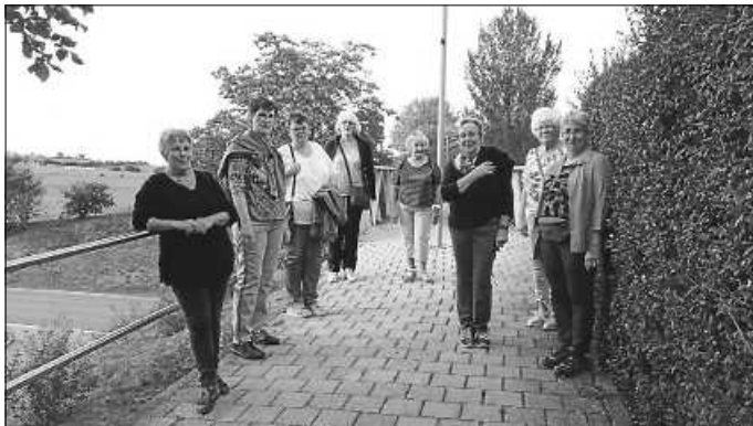
Unsere Landfrauen beim Ausflug rund um Wiernsheim