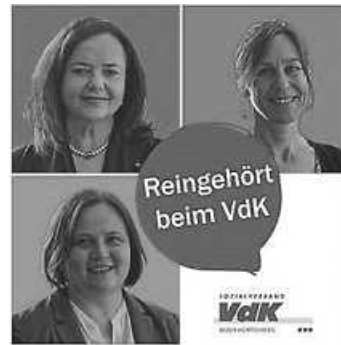
Reingehört beim VdK