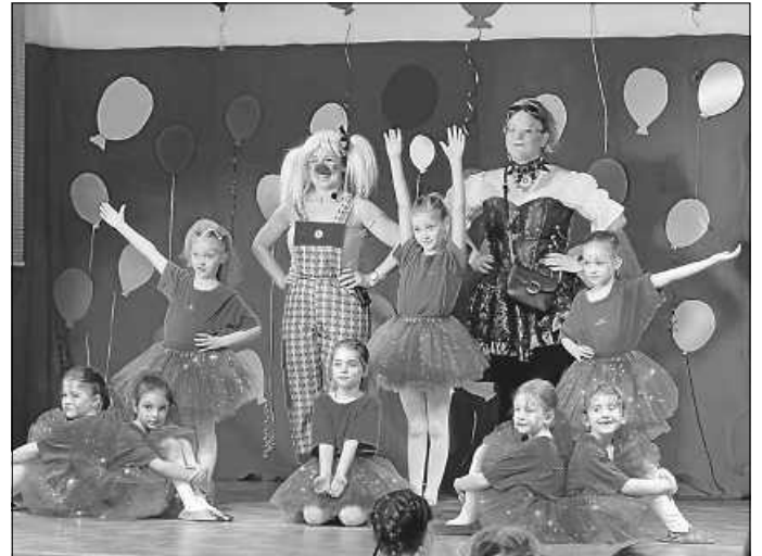
Tanzmäuse beim Auftritt mit „Wünsch dir was“