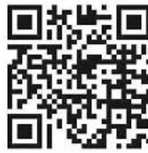
Code: T. U.

Genauso wollen wir mit euch dieses Event am 16. Juni in Mannheim in der SAP-Arena erleben! Zu Herzen gehend und verbunden mit tausenden von Kindern. Es ist noch nicht zu spät, um auf diesen Zug aufzuspringen!