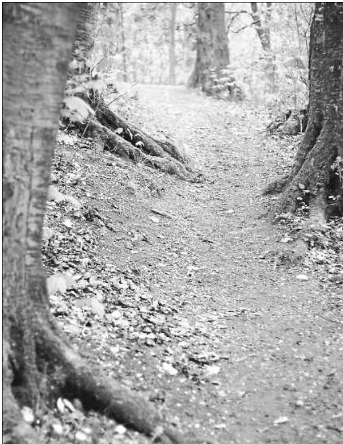
Der Wald ruft

Wir freuen uns, Sie alle nach dieser langen Zeit wiederzusehen.